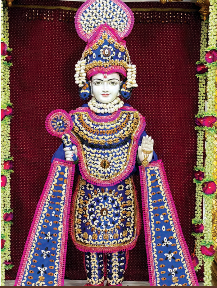
ચંદન તથા ડ્રાયફ્રૂટ વાદ્યા મધ્યે શોભતા ઘનશ્યામ મહાપ્રભુ