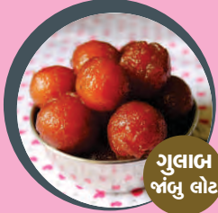
ગુલાબ જંબુ લોટ